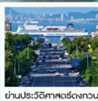
ย่านประวัติศาสตร์ตงกวน

Fisherman's Wharf • จตุรัสชิงไห่ (รวมรถราง) • ถนนตงกวน • เวนิสแห่งต้าเหลียน • ถนนรัสเซีย