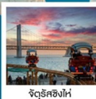
จตุรัสชิงไห่