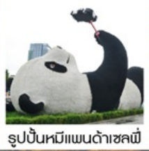
รูปปั้นหมีแพนด้าชหลี่