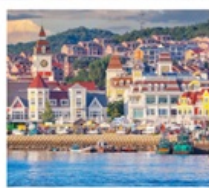
ท่าเรือประมงเหยียนโก๋

เรือลิวส์ / ย่านฮั่นเล่อฟาง / ถนนฮั่วจวิปา ท่าเรือประมงเหยียนโก๋ / ย่านฮงโหว่ 1920 / ถนนโบราณเฉาหยาง หอคอยกาลเวลา / ชายหาดจินซา / รูปปั้นปลาวาฬ / หาดทรายซาจื่อโหว่ หาดไซเบอร์ NO.3 / โรงงานเบียร์ชิงเต่า / โบสถ์ St. Emil ถนนคนเดินไต้ตง / สะพานจันเฉียว / จัตุรัส 54 / ห้าง MIXC