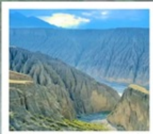
แกรนด์แคนยอนตู่ซานจื่อ