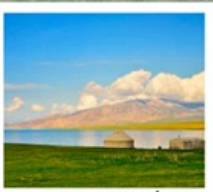
ทะเลสาบไซหลินู่

*ทุ่งดอกลาเวนเดอร์อียาเอ๋ออัน ( มิ.ย - ก.ค. )