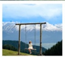
ทุ่งหญ้าคาลาจัน