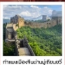
กำแพงเมืองจีนด่านมู่เถียนยวี่