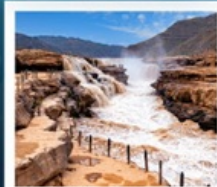
น้ำตกหูซั่ว