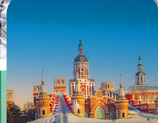
คฤหาสน์วอลก้า