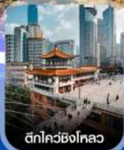
ตึกไควซิงโหลว

✈️ คอนเฟิร์มออกเดินทาง ทุกพีเรียด 2 ท่านขึ้นไป