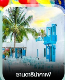
ซานตริ่น่าคาเฟ่