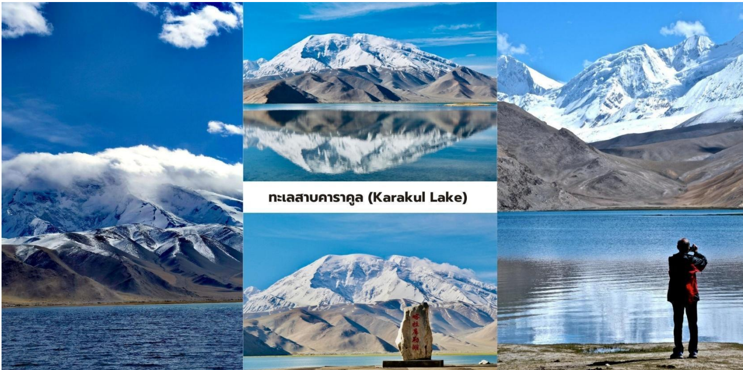
ทะเลสาบคาราคูล (Karakul Lake)

นำท่านแวะชม หนองน้ำดำเหอมา่น (Taheman Wetland/Taxkorgan Wetland) พื้นที่ชุ่มน้ำธรรมชาติบน ที่ราบสูงปามีร์ ซึ่งมีทุ่งหญ้าและลำธารกระจายตัวอยู่ทั่วบริเวณ พื้นที่แห่งนี้เป็น แหล่งอาศัยของนกอพยพและสัตว์ป่านานาชนิด โดยเฉพาะในช่วงฤดูใบไม้ผลิและฤดูร้อนสามารถพบนกหลายชนิด เช่น นกกระเรียน นกฟลามิงโก และนกเป็ดหลากสายพันธุ์ เป็นต้น ในส่วนของบริเวณทิวทัศน์ของพื้นที่ชุ่มน้ำแห่งนี้โดดเด่นด้วย แม่น้ำที่คดเคี้ยวผ่านทุ่งหญ้าสีเขียว โดยมีฉากหลังเป็นภูเขาหิมะแห่งเทือกเขาปามีร์สร้างภาพธรรมชาติที่แตกต่างจากภูเขาหินที่แห้งแล้งของภูมิภาคโดยรอบ