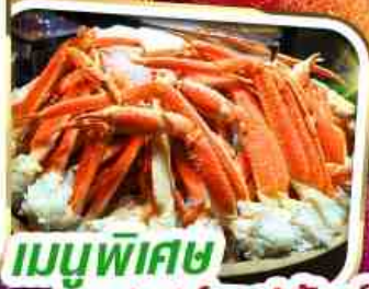
เมนูพิเศษ บุฟเฟ่ต์ขาปูยักษ์

ราคาเพียง 35,999 *รวมภาษีมูลค่าเพิ่มแล้ว*