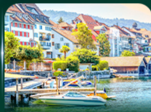
เมืองสวยริมทะเลสาบ ชุก