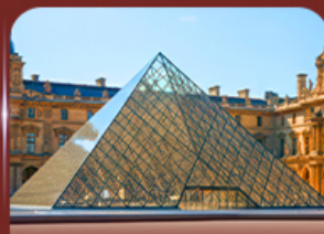
เช็คอินพิพิธภัณฑ์ลูฟวร์ ปารีส