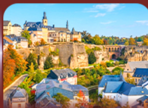
ย่านเมืองเก่า ลักเซมเบิร์ก