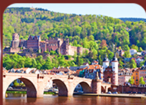
ชมเมืองสวย ไชเตลเบิร์ก