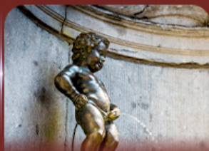
manneken pis บรัสเซลส์