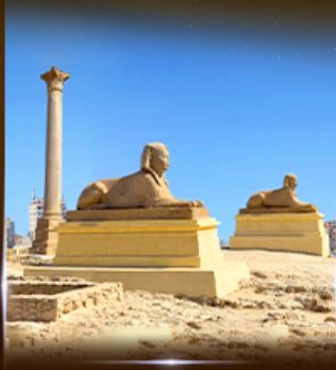
เสาโรมันปอมเปอี