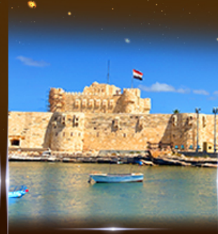
ป้อมปราการ Quite Bay