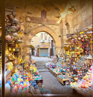
ตลาดห่านเอลคาลี