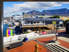
ท่าเรือ V&A waterfront