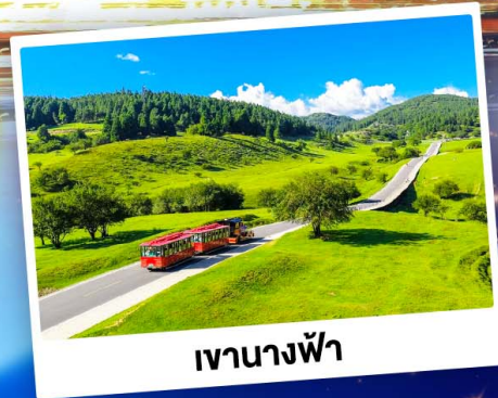
เจานางฟ้า