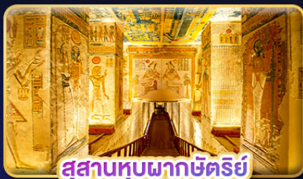
สุสานทูบพากซ์ตรีย์