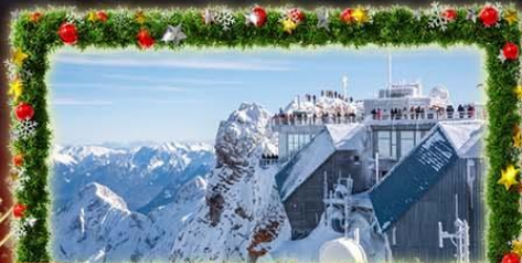
พีชิต Zugspitze Top Of Germany