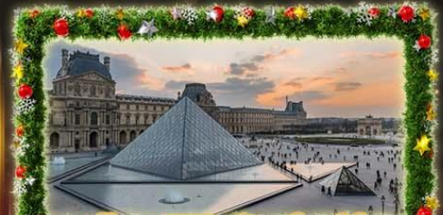
เจ้าชมพิพร์ภันท์ลูฟท์