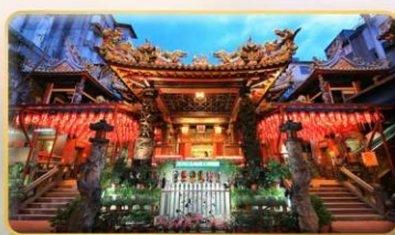
วัดเทียนโฮ่ว จอพริเจ้าแม่หม่าจู