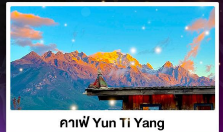
กาแฟ Yun Ti Yang