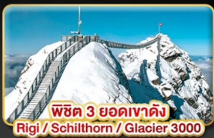
พีชิต 3 ยอดเขาดัง Rigi / Schilthorn / Glacier 3000