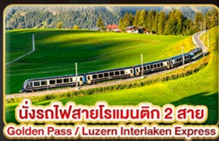
นั่งรถไฟสายโรแมนติก 2 สาย Golden Pass / Luzern Interlaken Express