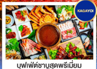
บุฟเฟ่ต์ชาบูสุดพรีเมียม