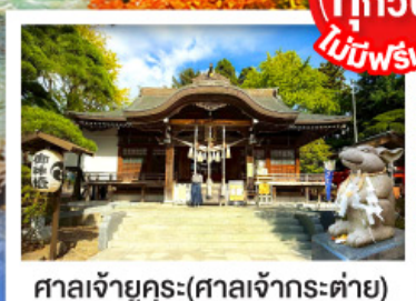
ศาลเจ้ายุคุระ (ศาลเจ้ากระต่าย)

พิเศษบุฟเฟ่ต์ชาบูสุดพรีเมียม ปูออกโทโด อาหารทะเล เนื้อวากิว สเต็ก ซูชิโอคุระ และเครื่องดื่มไม่อัน