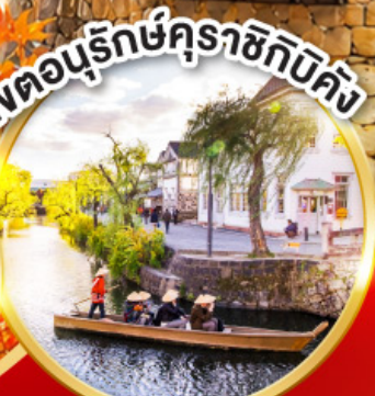
เขตอนุรักษ์คุราชิกิบิคัง