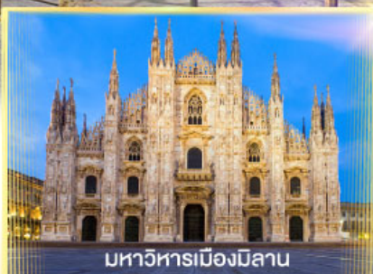
มหาวิหารเมืองมิลาน