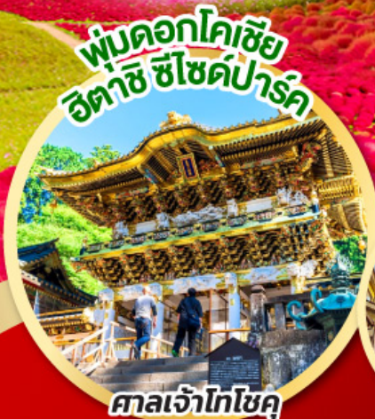
พุ่มดอกโคเชีย ฮิตาชิ ซีไซด์พาร์ค