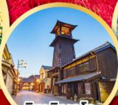
ลิตเติลเอโดะ เมืองควาโกเอะ