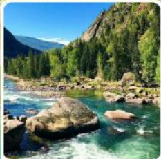
อุทยานเคอเคอทั้วไห่