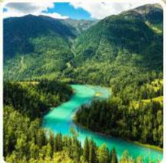
ทะเลสาบคานาสือ