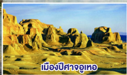
เมืองปิสางจือเหอ