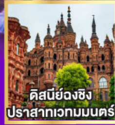
คิสนียงซิ่ง ปราสาทเวกมนตร์