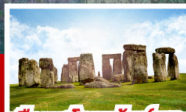
เยื่อนสโตนเฮ็นจ์ และ พิพิธภัณฑโรมันบาร