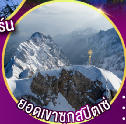
ยอดเขาชุกสปีตซ์