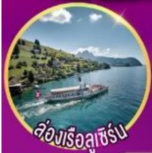
ห้องเรือลูเซิร์น