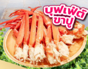
บุฟเฟต์บายู