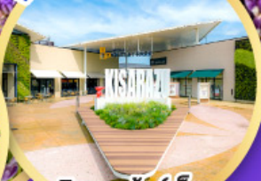
มิตซูเออิเกิ้ล พาร์ค คิซะระซู