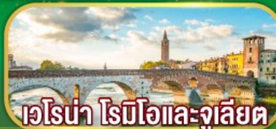
เวโรน่า โรมีโอและจูเลียต

เดินทาง 07-14 เม.ย. 69 / 02-09 พ.ค. 69 27 พ.ค. - 03 มิ.ย.69 / 17-24 มิ.ย.69 22-29 ก.ค. 69 / 11-18 ส.ค. 69 16-23 ก.ย. 69