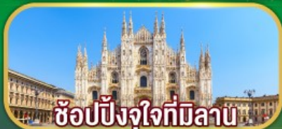
ซอปปิงใจที่มิลาน