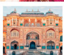
♡♡▽ Amber Fort