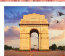
♡♡▽ India Gate