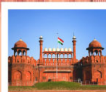
♡♡▽ Agra Fort