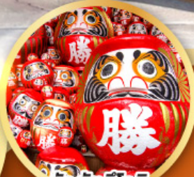
วัดคิตสึโฮจิ (วัดดามะ)

ชมความงามของกำแพงหิมะ เส้นทางสายอัลไพน์ ทาคายามา (JAPAN ALPS SNOW WALL)