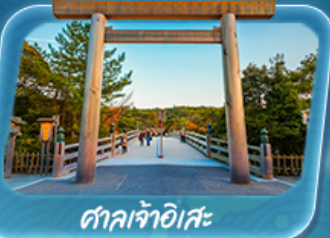
ศาลเจ้าอิสะ

12 - 17 พ.ค. 69 / 19 - 24 พ.ค. 69 26 - 31 พ.ค. 69 / 2 - 7 มิ.ย. 69 9 - 14 มิ.ย. 69