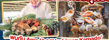
พบกับ Ama Hut "Haohiman Kamado" เมนูพิเศษ SEA FOOD