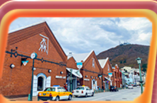
โค้งอิฐแดง