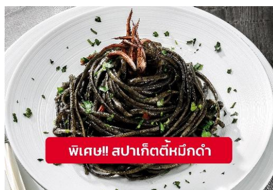
พิเศษ!! สปาเก็ตตี้หมีดำ

Highlight! เมื่อเยือนเกาะเวนิส เมนูที่ขึ้นชื่อและหากได้มาต้องได้ลิ้มลองสปาเก็ตตี้พุดชอสหมีดำที่คลุกเคล้ากับความหอมนุ่มนวลกับบรรยากาศ สุดคลาสสิคฉบับอิตาลีเริ่มต้นที่รับเวนิส