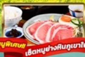
เมนูพิเศษ เชื้อหมูย่างสินภูเขาไฟ