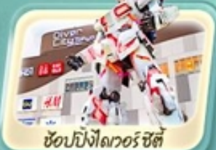
ช้อปปิ้งไอเวอรี่ ซิตี้

ชมวิวภูเขาไฟฟูจิ สวนโออิชิ หมู่บ้านน้ำใสโอชิโนะ อักโท เยือนวัดเซ็นโซจิ อาซากุสะ ตลาดปลา Toyosu ช้อปปิ้งจุกี่ห้างดัง ไอเวอรี่ ซิตี้