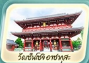
วัดเซ็นโซจิ อาซากุสะ