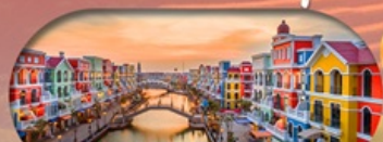
MEGA GRAND WORLD HANOI แลนด์มาร์คแห่งใหม่