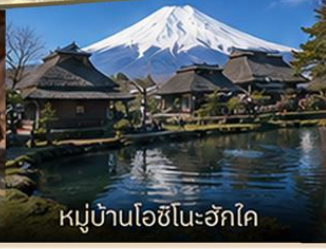
หมู่บ้านโอชิโนะฮักโค