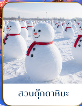
สวนตุ๊กตาหิมะ