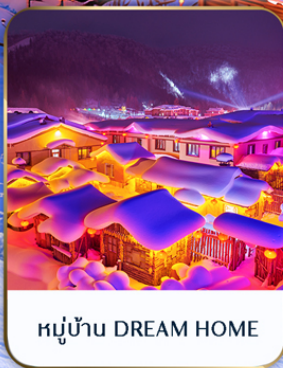
หมู่บ้าน DREAM HOME