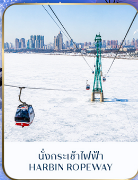
นั่งกระเช้าไฟฟ้า HARBIN ROPEWAY