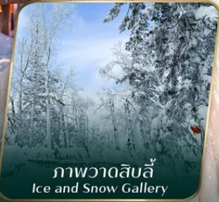
ภาพวาดสิบลี Ice and Snow Gallery

คอนเฟิร์มออกเดินทาง ตั้งแต่ 15 วัน ขึ้นไป