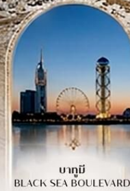
บาทุบี BLACK SEA BOULEVARD