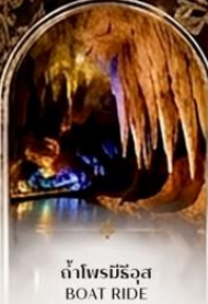
ดำโพรมิรัฐอส BOAT RIDE

เดินทางช่วงปีใหม่ 27 ธ.ค. - 3 ม.ค. 70 ราคาเพียง 75,989 บาท / ท่าน