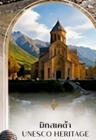
มิกสเคต้า UNESCO HERITAGE