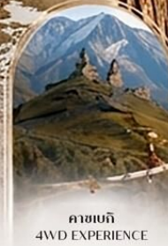
คาสเบกี 4WD EXPERIENCE