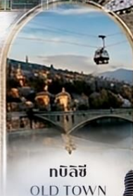
ทบิลีซี OLD TOWN