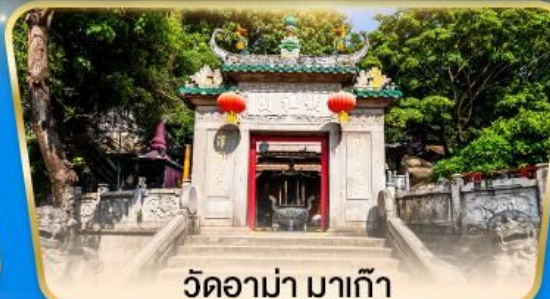
วัดอาม่า มาเก๊า