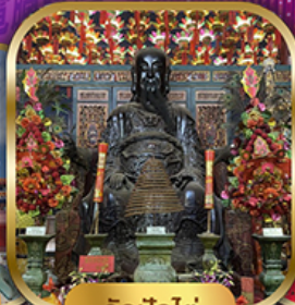
วัดปุกใต้