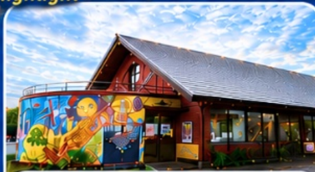
หมู่บ้านราเมนอาซาฮิกาวะ