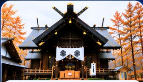
ศาลเจ้าคามิดาวะ