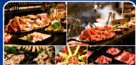
THE SAKURA BUFFET