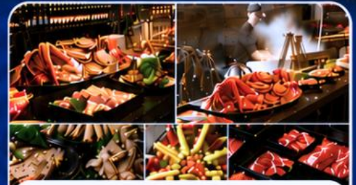
THE SAKURA BUFFET