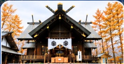
ศาลเจ้าคามิคาวะ