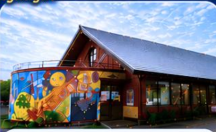
หมู่บ้านราเมนอาซาฮิกาวะ