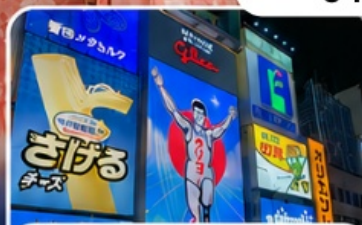
ช้อปปิ้งซินโซบาชิ