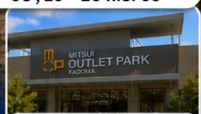
ช้อปปิ้ง MITSUI OUTLET KADOMA