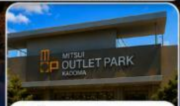
ช้อปปิ้ง MITSUI OUTLET KADOMA