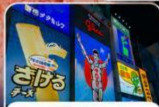
ช้อปปิ้งชินโซมาชิ