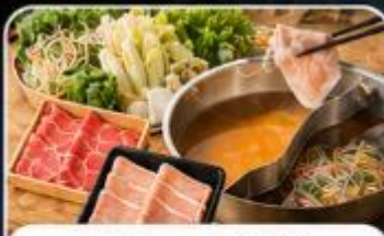
บุฟเฟ่ต์ซาบูสไตล์ญี่ปุ่น

เดินทาง : 19 - 23 ส.ค. 04 - 08 , 16 - 20 ก.ย. 69