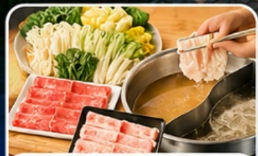
บุฟเฟ่ต์ชาบูสไตล์ญี่ปุ่น

เดินทาง : 19 - 23 ส.ค. 04 - 08 , 16 - 20 ก.ย. 69