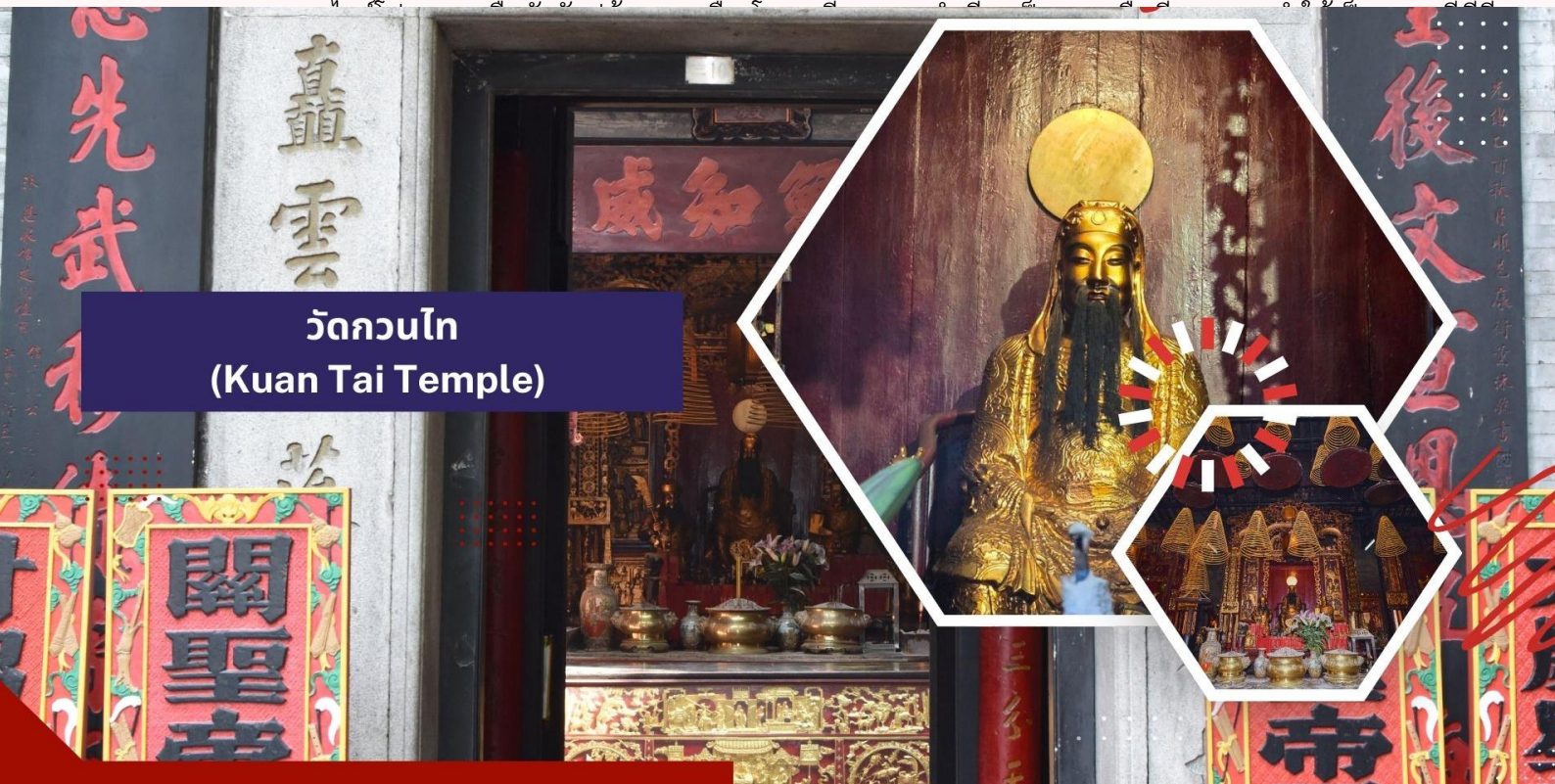
วัดกวนไท (Kuan Tai Temple)

นำท่านเดินทางสู่ เซนาโดสแควร์ เป็นจัตุรัสสำคัญในใจกลางเมืองมาเก๊า มีลักษณะเป็นพื้นที่เปิดโล่งที่ล้อมรอบด้วย