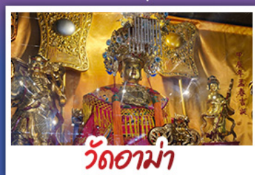
วัดอาฮาม่า

CHIMELONG SPACESHIP PARK CHIMELONG OCEAN KINGDOM จุฬาราชมนตรี ศาลเจ้าแม่กวนอิมริมทะเล วัดอาฮาม่า วัดกวนไท - เจ้าแม่กวนอิมริมทะเล วัดอาฮาม่า