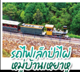
รถไฟเล็กป่าไผ่ หมู่บ้านหย่าหู่