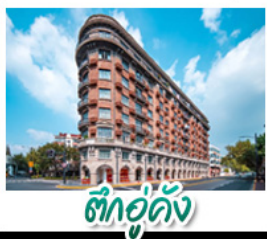
ตึกอู่คัง

รถไฟเล็กป่าไผ่หมู่บ้านหย่าหู่ - หมู่บ้านเหนียนฮวาวาน