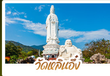
วัดเข็กนึ่ง