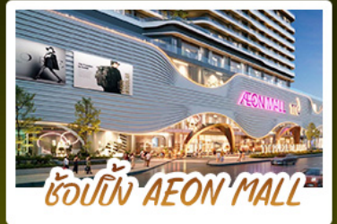
ช้อปปิ้ง AEON MALL